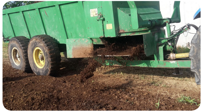
Alimentazione con carro spandiletale